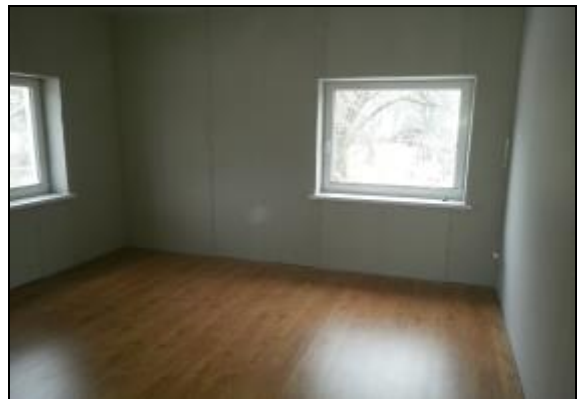
Nuotraukose: būsto atnaujinimo darbai – nuo vagonėlio demontavimo - iki įrengtų kambarių