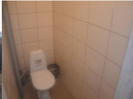
Keletas atliktų darbų nuotraukų

Šeimai iš Pasvalio rajono, tėtis vienas augina du vaikus, buvo nupirkta sofa lova vaikams ir virtuvės indai. Paramos dydis: 277 EUR.